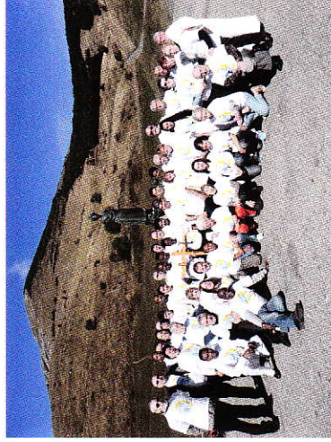
Sanctuaire Sept/Oct 2016

2 ème rencontre internationale des laïcs salettins